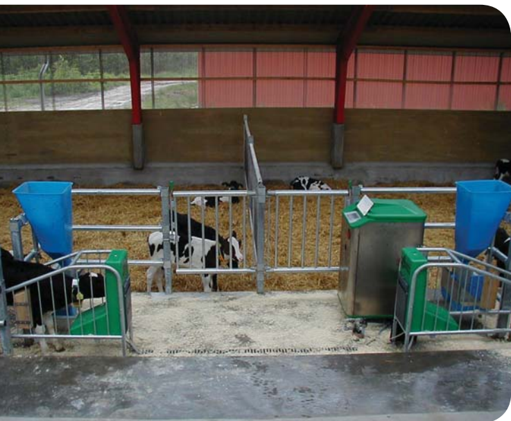
Afløbsrist sørger for at der er tørt omkring drikkestationerne