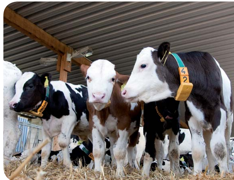
Resultatet: Sunde kalve