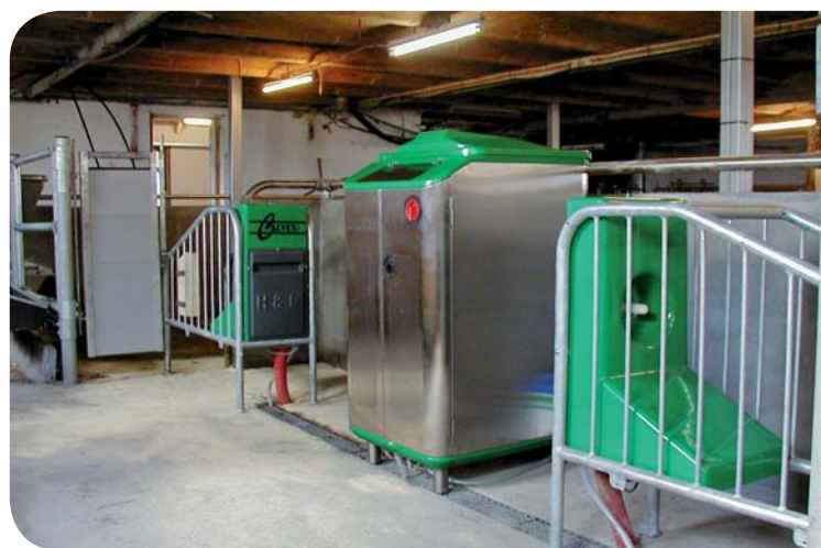
Praktisk bokslåge ved siden af drikkestationen