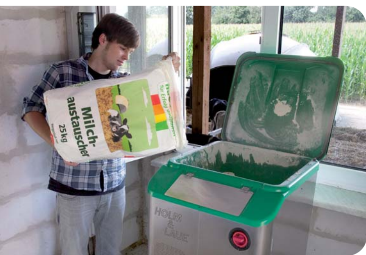
Lav ifyldningshøjde gør arbejdet let