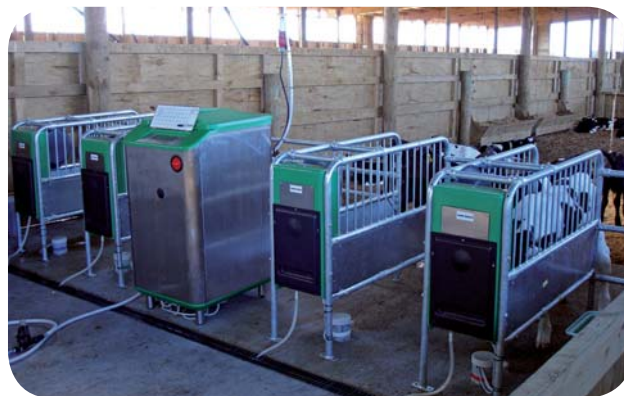
Op til 100 kalve pr. mælkeautomat