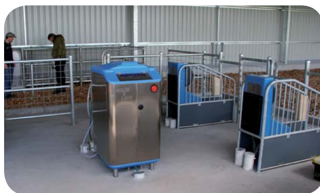
Velafprøvet Holm & Laue vejetechnik