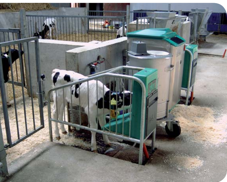
Mælkeautomat med mulighed for tilsætning af komælk