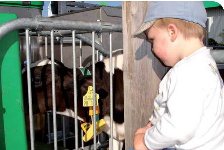
Fokus på de vigtige ting i livet