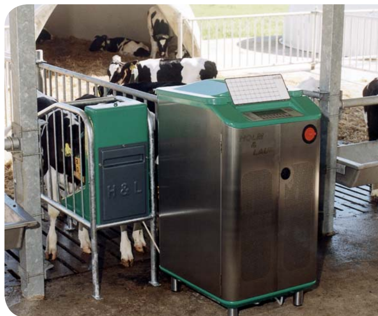
Robust teknik, der matcher de praktiske forhold på gården.