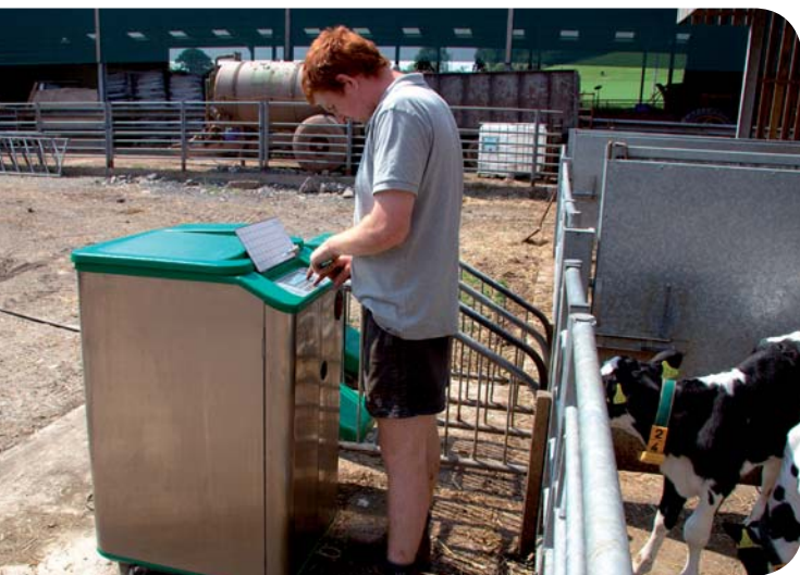
Vigtige informationer på et øjeblik