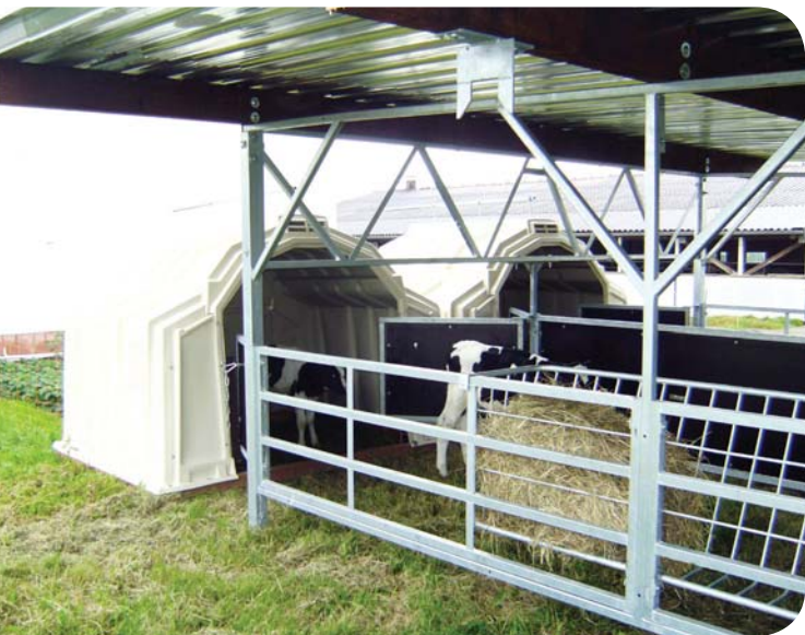
Små kalvegrupper i MultiMax Veranda